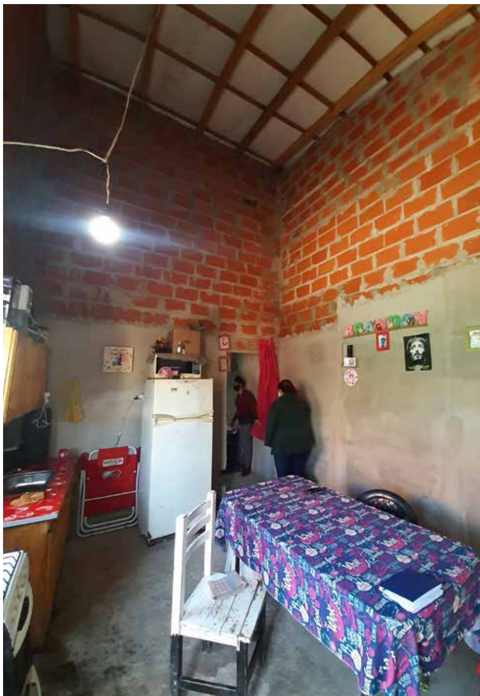
Barrio 23 de Diciembre, Moreno. El estudio verifica que los elementos componentes de cada unidad habitacional y la forma de ejecutarse son muy similares, predominando casi exclusivamente el uso de técnicas y materiales tradicionales.